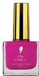
● 1 ЖЕМЧУГ / PWM03919-B ean 5900793039193

Карандаш, который придаст взгляду выразительность и подчеркнёт глубину Ваших глаз. Специально разработанная формула, на основе масла какао, обеспечивает высокое качество продукта и исключительный комфорт использования. Благодаря приятной текстуре карандаш легко наносится, позволяя делать линии идеальной толщины, не вызывая раздражений и других неприятных ощущений. С помощью карандаша Pani Walewska возможно создание и элегантного дневного, и более эффектного вечернего или праздничного макияжа.